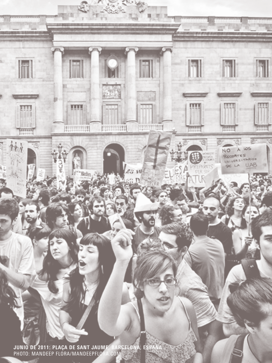
JUNIO DE 2011: PLAÇA DE SANT JAUME, BARCELONA, ESPAÑA